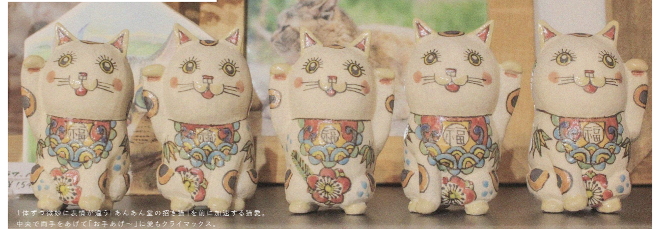
1体ずつ微妙に表情が違う「あんあん堂の招き猫」を前に加速する猫愛。中央で両手をあげて「お手あげ〜」に愛もクライマックス。

たとえば道端で弱っている猫を見つけたとき、あるいは食べ物求めて寄ってきたとき、「飼えない自分」に何ができるだろう。自らの無力さを憂う前に、いざというときに無責任な選択をしてしまう前に、まずは「知ること」からはじめよう。はじめの一步を踏み出すために、中島川沿いにある〈尾曲がり猫神社〉さんで話を聞いてきました。